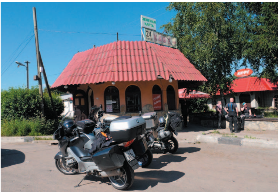
En typisk russisk veikro

Neste dag fortsetter vi mot Joensuu i nordre Karelen. Personlig har jeg aldri kjørt i denne delen av Finland