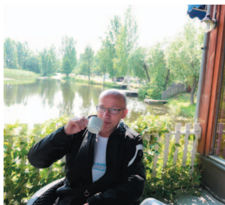
En kaffetår i idylliske omgivelser. Karelen i Finland er et naturskjønt område.

Russiske motorveier. Et kapittel for seg. Vi lærer fort at her er det egne regler som gjelder. Jeg skvatt kraftig til da en hvit varebil plutselig suste forbi meg i rasende fart på veiskulderen på høyre side. Fra da av fulgte jeg påpasselig med i begge spillene.