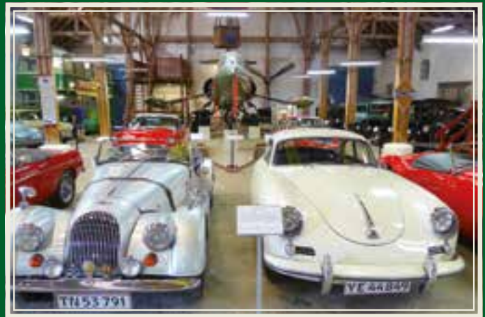
Litt av bilsamlingen, i forgrunnen grevens Morgan +8 og en Porsche 356.