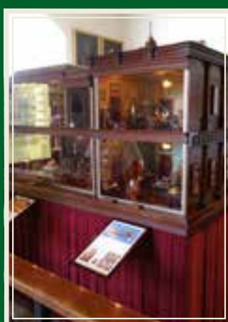
Titantias palass, verdens mest eventyrlige dukkehus.