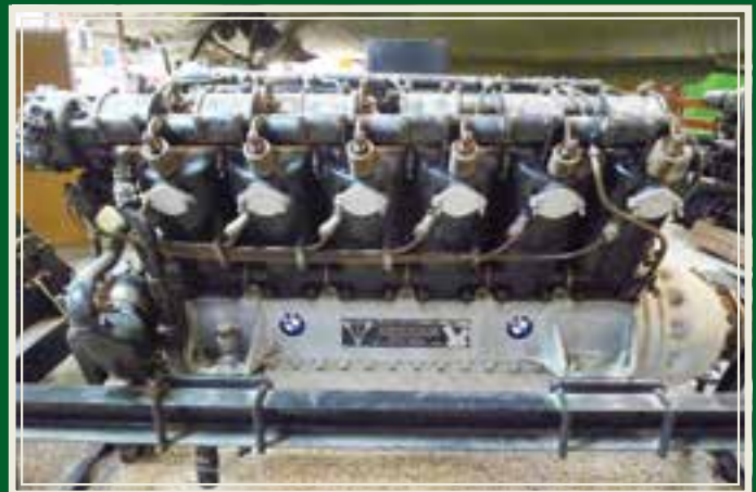
BMW type VI, V12 flymotor med 46 liter slagvolum og ca 650 hp, produsert 1926-1938.