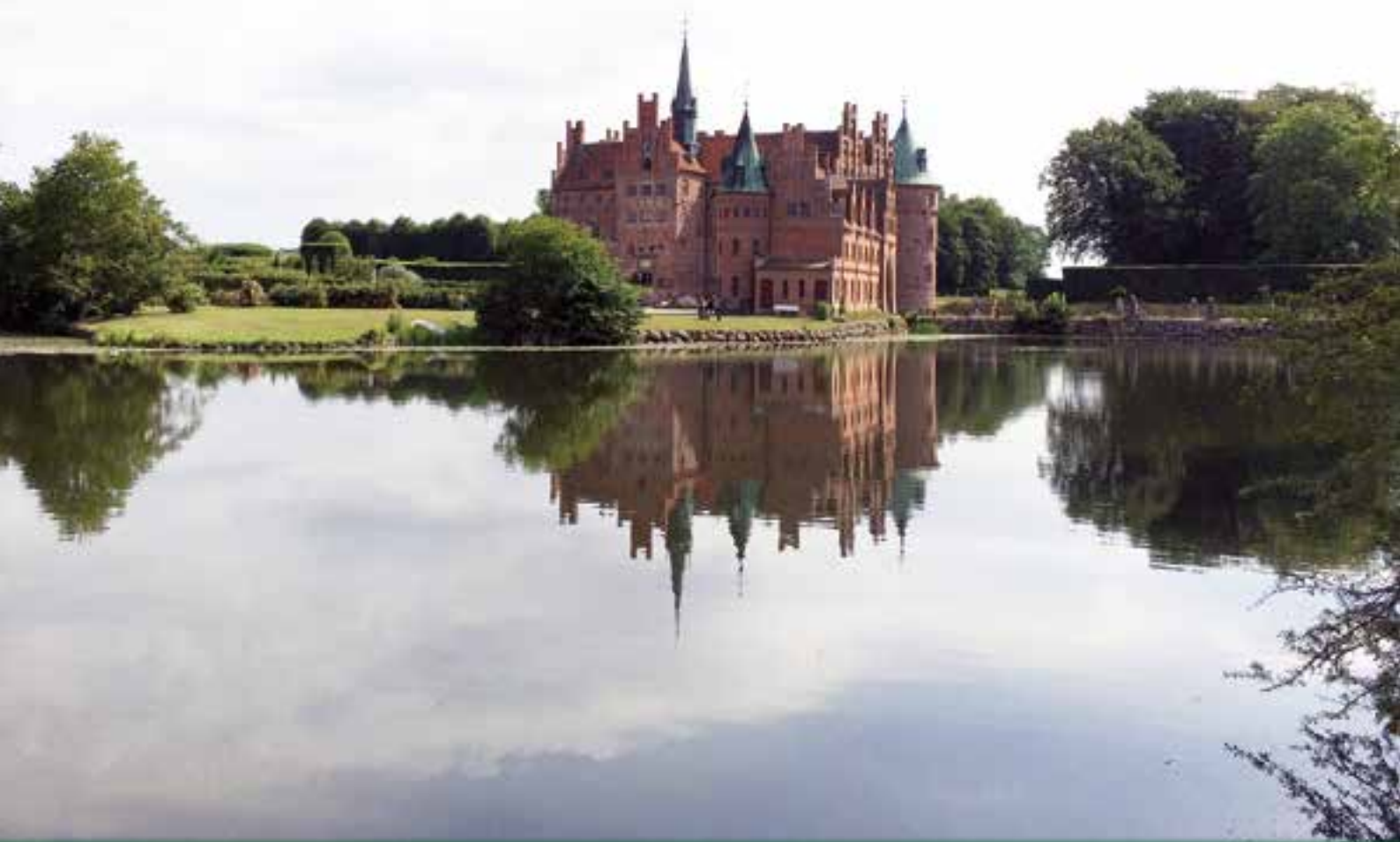
Egeskov Slot, med en del av vollgraven i forgrunnen.