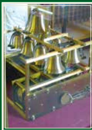
Denne kunstferdige "spilledåsen" står i samme rom som Titantias palass.

over på Egeskov. Labyrintene er allerede nevnt, men hva med en ridderturnering hvor "hesten" heter Segway? Barn og voksne med bare moderat høydeskrekk kan skaffe seg en formidabel oversikt langs ca 100 m med hengebroer mellom trærne, 10-15 m over bakken. Lekeskogens lekeområder (omkranset av trær med kun spiselige frukter) passer for de yngre barna, og slitne foreldre kan late seg i skyggen av