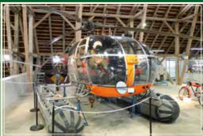
Aérospatiale Alouette III, produsert fra 1961 til 1985.