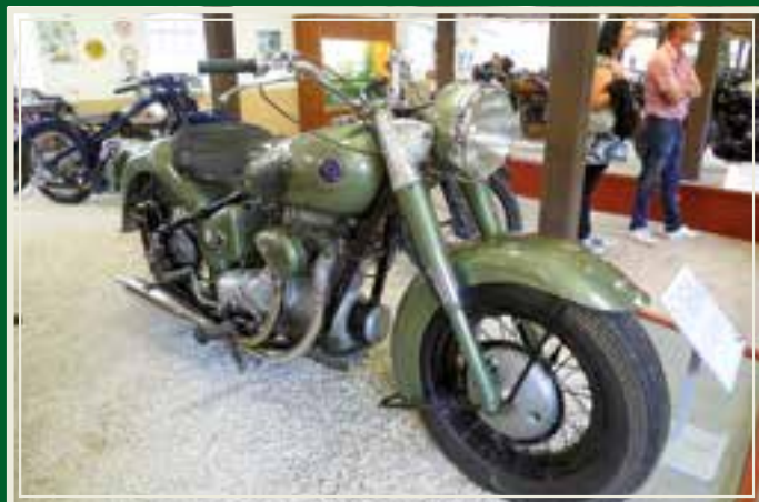
Sunbeam S7, produsert i perioden 1946-1956.