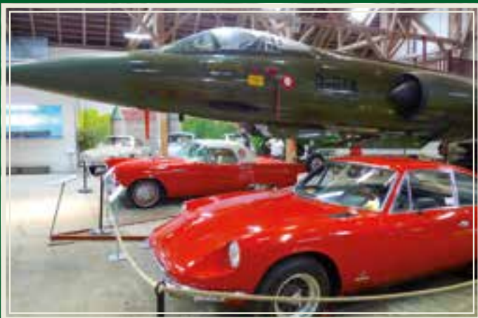
Canadair CF-104 Starfighter i fornemt selskap.