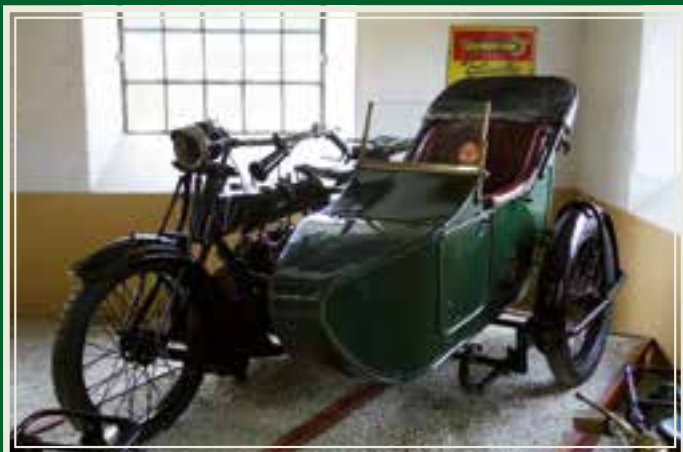
AJS 5-6 hp med sidevogn, produsert 1910-1920.