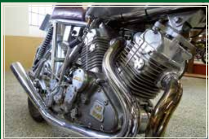
The Great Dane 1000, produsert i ett eksemplar av Gunmar Sørensen fra Horsens.