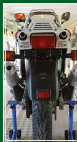
Bakenden på en Yamaha RD 500, en del av særutstillingen Japanske Motorcykler 1970-90.