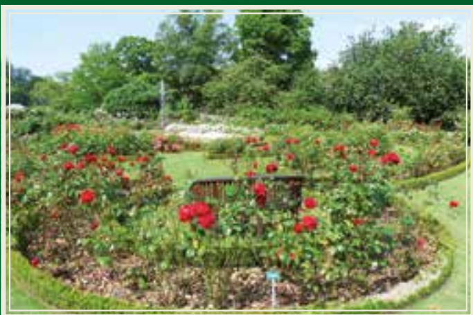
Noen av rosehagens skjønnheter, sett med ryggen mot slottet.