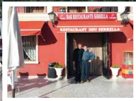
Den hyggelige kafeen Nou Serrella.