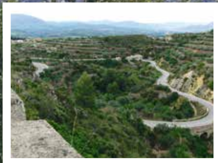
Svingete veier mot Tarbena