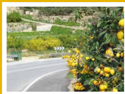
Situstrær og svinger