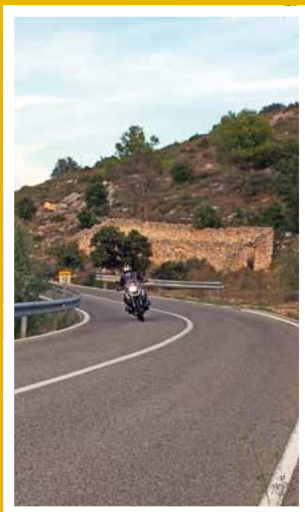
På tur mot Castell del Castells