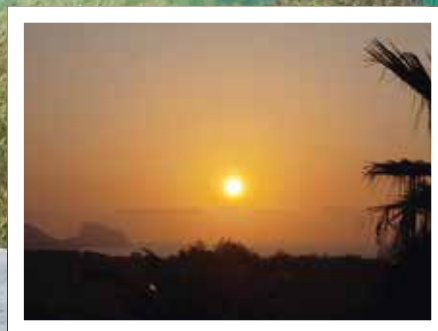
Solnedgang over Casa Ramasa