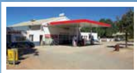
PROTEA: Bensinstasjonen Thinus driver er ikke akkurat prangende, men skjuler uvurderlige skatter for den motorsykelinteresserte forbipasserende. Protea (eller egentlig arten King Protea) er for øvrig Sør-Afrikas nasjonalblomst.