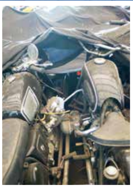
EPOKER: Ikke alle syklene hos Thinus er like gamle. Her finnes sykler fra 1898, og fra 1998. Og fra alle tiårene i mellom.