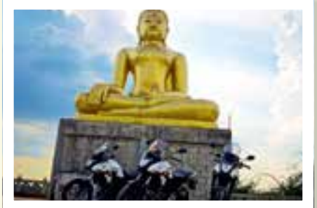
BUDDHA: Slike enorme Buddha-statuer finnes nær sagt over alt langs ruten vi kjører.