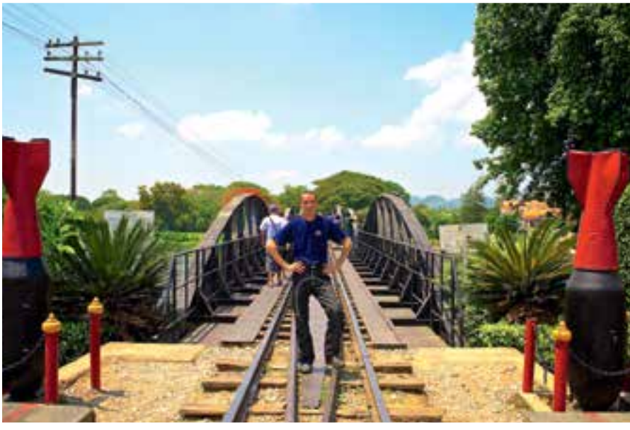
«SELFIE»: Skrytebilde av artikkelforfatteren på den berømte broen over elva Kwai. Broen hadde «hovedrollen» i David Leans berømte film fra 1957.

P å diplommet vi ble overrakt utenfor turistkontoret i Mae Hong Son står det høytidelig: «This certificate certifies that Diseth Claus has successfully completed the journey to Mae Hong Son, crossed 1,864 curves».