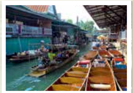
OPPLEVELSER: Vi gjør mer enn å kjøre motorsykel. Her legger vi ut på tur gjennom et «vannmarked» i en liten by utenfor Bangkok.

Yep. En diger elefant. Og ut i jungelen bærer det. Over trestokker, gjennom busk og kratt. Det duver og bølgjer nesten som en fregatt i rom sjø. Og der hoppet jaggu «sjåføren» av, og jeg sitter plutselig i «førersetet». Som er omtrent midt på skallen til elefanten «Jomi».