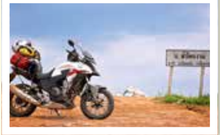
PÅ GRENSEN: Fra Bangkok settes kursen nordover, og vi kjører mange mil langs grensen til Myanmar (Burma).