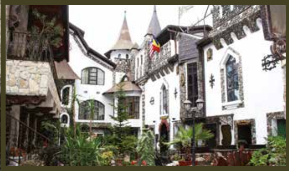
Hotellet Draculas Castle i Turdu