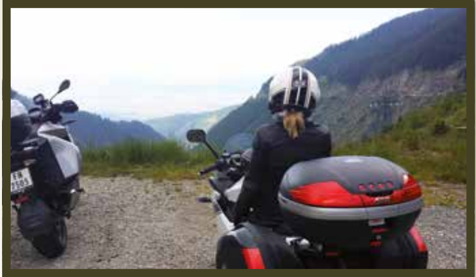
Like over toppen. Nedstigning skal begynne

der fattigdommen er godt synlig. Løshunder er et stort problem i Romania, og de rusler gjerne langs veiene, så det lønner seg å ha et øye på grøftkantene. Vi hadde imidlertid ikke en eneste negativ opplevelse i forhold til å føle oss utrygge.