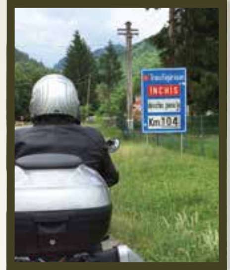
Henning ved starten av transfagarasan