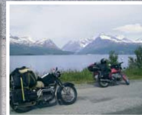
Vakre Lyngen krever en fotostopp.

Gale, ja vel, men vi vet en del om ferietur på veteranmotorsykel der det ikke en eneste dag var gruing for å sette seg på sykkel og dra videre. Helsa holdt utrolig godt og det ble ikke utvokst en eneste heftig diskusjon mellom oss. Jeg er faktisk klar for neste tur.