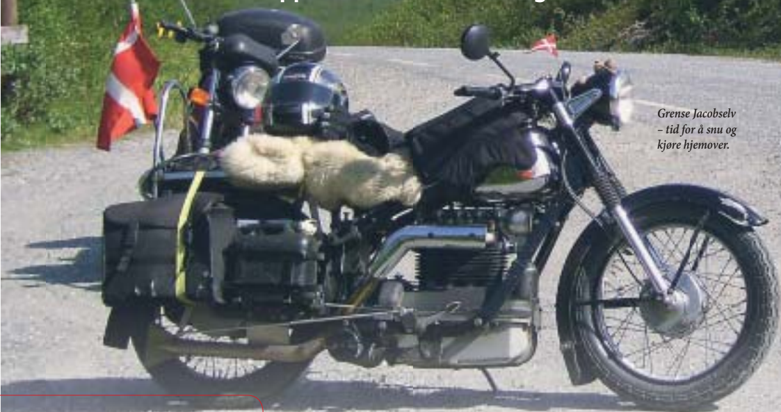
Grense Jacobselv – tid for å snu og kjøre hjemover.

Veterantur til Nordkapp med Nimbus 1952 og BMW R45 1979.