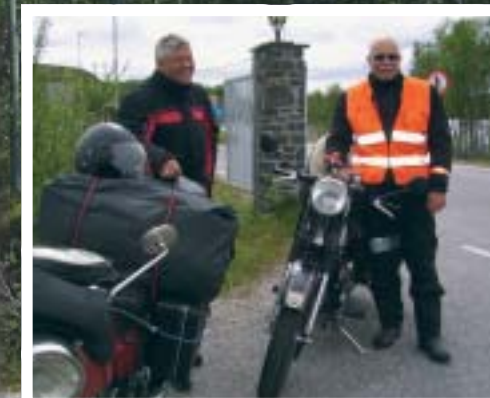
Veteranene på veteranmotorsyklar har kommet fram til russergrensa.